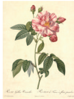
ロサ・ガリカ・ウェルシコロラ「ロサ・ムンディ」