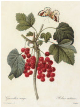
レッドカーラント(赤フサスグリ)