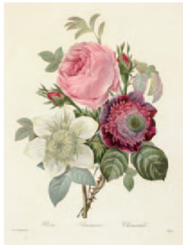
ロサ・ケンティフォリア、アネモネ、テッセン