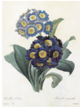
ブルムラ・オーリキュラ(サクラソウ)