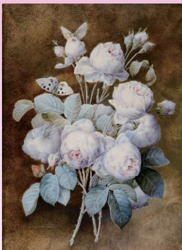
『肉筆画』 《バラのブーケ》