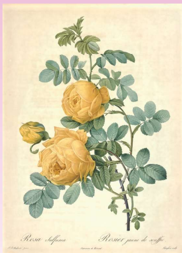
『バラ図譜』より 《ロサ・スルフレア》