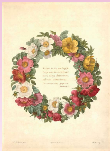
『バラ図譜』より 《リース》

本展ではルドゥーテの代表作『バラ図譜(Les Roses)』(1817～24年刊行)に収録される版画全点に加えて、2点の肉筆画を紹介します。およそ170点の精緻なバラの作品をお楽しみください。