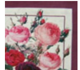
#2: ビビッド・ホワイト