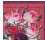
#1: ビビッド・レッド