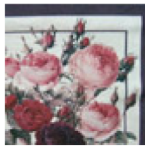
#1 : ビビッド・レッド #2 : ビビッド・ホワイト #3 : ロココ・レッド #4 : ロココ・ホワイト

人気のチンツ柄のエコ・バッグです。全ての面にチンツ柄が入っています。 色は4種類の中からお選びいただけます。