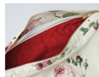
内側はフューシャピンク生地