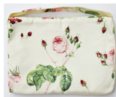
物が入っていない状態