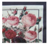
#1：ピビッド・レッド #2：ピビッド・ホワイト #3：ロココ・レッド #4：ロココ・ホワイト