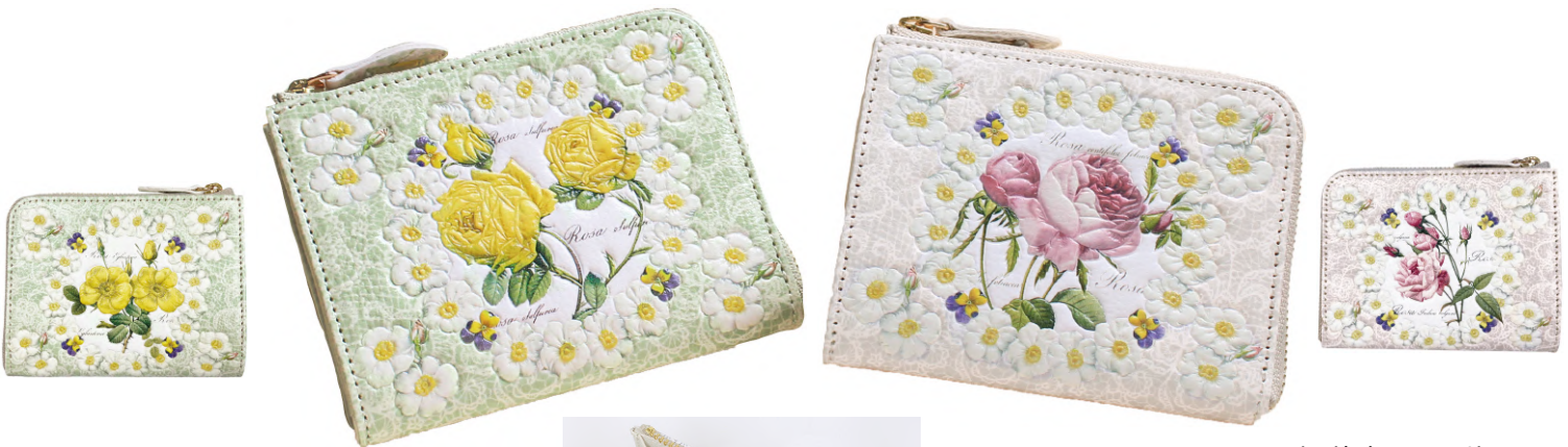
M015S / ロサ・スルフレア