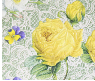
M014S / ロサ・スルフレア