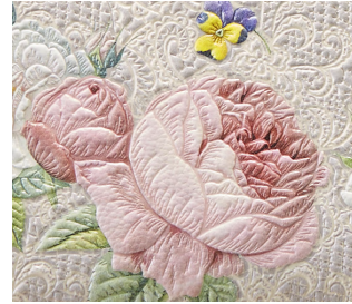
M014R / ロサ・ケンティフオリア